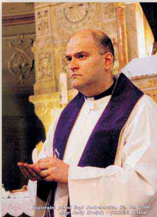
Pastoralni pohod župe Draganić, 28. 07. 2006.